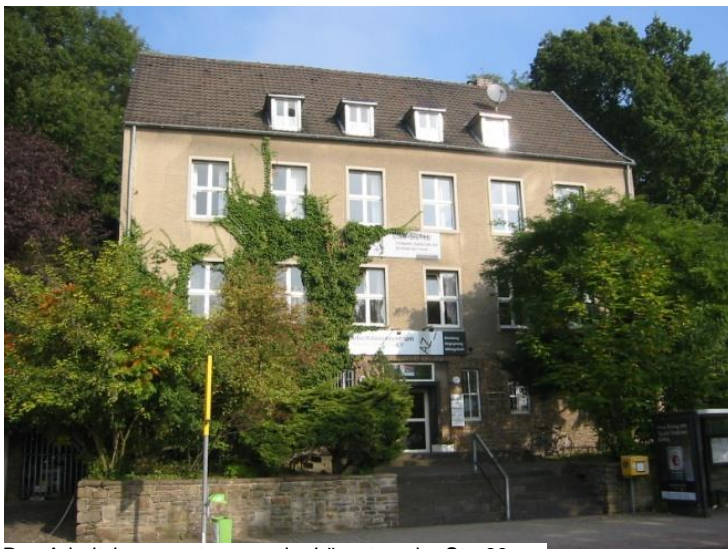
Das Arbeitslosenzentrum an der Lüpertzender Str. 69.

Leider gibt es bisher in Deutschland kein einheitlich geregeltes soziales Hilfeangebot für Familien und Haushalte, die in Folge von Arbeitslosigkeit in wirtschaftliche und soziale Schwierigkeiten geraten sind. Die Folgen der Arbeitslosigkeit werden in unserem Hilfesystem immer nur am Rande mitbearbeitet; dies gilt in besonderem Maße für das Gesundheitssystem.